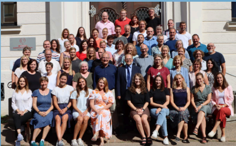
Das Lehrerkollegium 2023/24